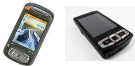
CAMPANHA VIDEO ou AUDIO